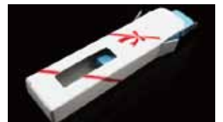
専用の化粧箱へのセットも承ります