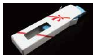
専用の化粧箱へのセットも承ります