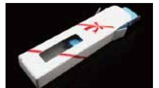
専用の化粧箱へのセットも承ります